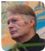
Jean-Marie Gustave Le Clézio

Writer, 2008 Nobel Laureate of Literature