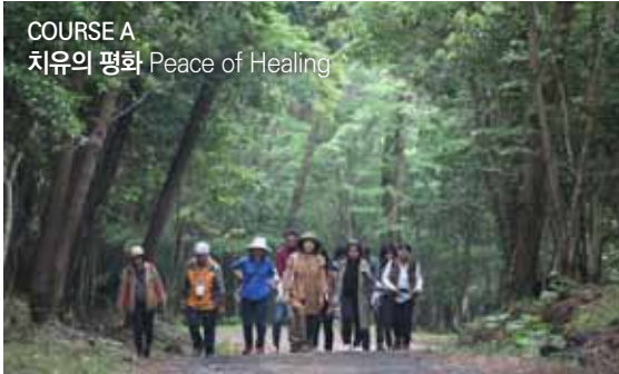
COURSE A 치유의 평화 Peace of Healing