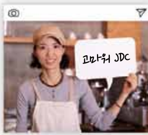
#마을기업 #주민일자리 #서광리