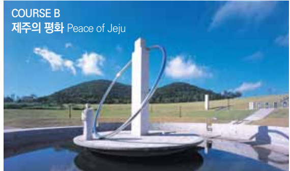
COURSE B 제주의 평화 Peace of Jeju