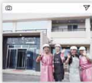
#마을기업 #마을경제 #보성리