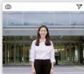
#투자기업 연계 전문가 인재 양성