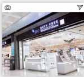
#JDC면세점 #수익전액 환원