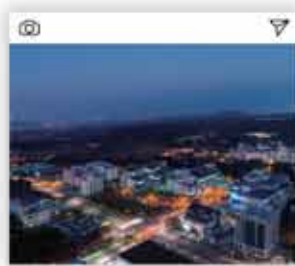
#첨단과학단지 지역 경제 활성화