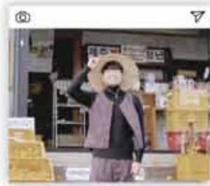
#마을기업 #청년농부 #알뜨르