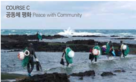
COURSE C 공동체 평화 Peace with Community

COURSE A June 28 13:30~17:30, 29 08:30~13:00