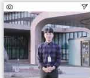
#첨단입주기업 고용창출 #IT BT